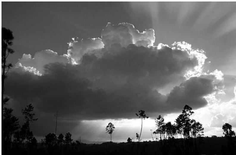
Un cumulonimbo fotografado en Socastro (San Mamede de Ribadulla, Vedra) o 17 de setembro de 2000.