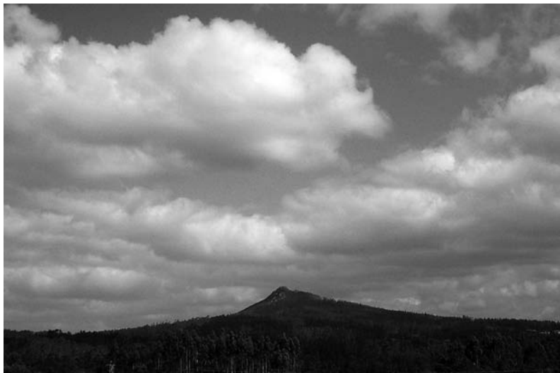
Cúmulos sobre o Pico Sacro o 28 de abril de 2002. Se o Pico Sacro tivese posta a touca ou capelo as nubes ocultarían a cima e iso sería sinal de chuvia.

A touca (pano da cabeza) ou capelo (sombreiro) ós que se refiren algunhas destas coplas e refráns aparecerá a meirande parte das veces pola entrada de aire húmido desde o Atlántico. As masas de aire que veñen do sudoeste, que son as que deixan maiores cantidades de chuvia entran polo Val do Ulla. Ó atopar o Pico Sacro a masa de aire vese forzada a ascender de xeito que se enfría lixeiramente ocasionando a condensación e a presenza de nubes ou néboas que ocultan a cima do monte. Polo tanto esta sería unha primeira pegada da chegada de masas de aire do sudoeste. A copla e o último refrán presentan unha certa contradición: normalmente será de aplicación a copla, posto que o mais habitual en Galicia son as chegadas de fronte frías que teñen máis cantidade de auga; as fronte cálidas pasan normalmente máis ó norte.