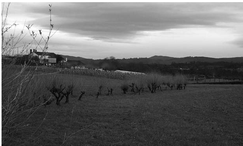
Estrato de nubes sobre o Val do Ulla o 21 de decembro de 2000.

Por iso son mellores os enxamios de marzo e abril porque chegan xa en primavera e as abellas teñen de que alimentarse.