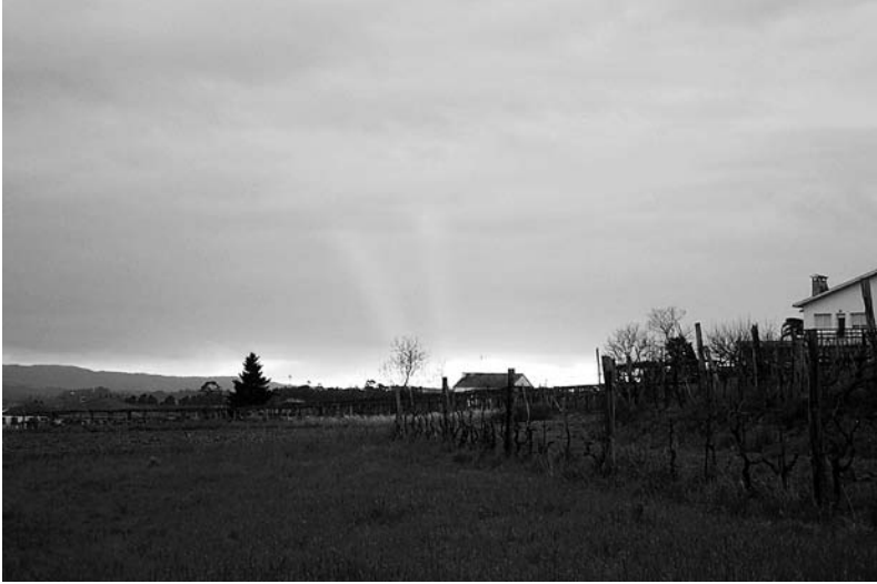
Un solpor coma este, do 24 de febreiro do 2002, no que se ven nubes de cor vermella, indica posibilidade de chuvia para o día seguinte.

en zonas onde abunda máis que na Ulla a gandería ovina. A palabra rubiás sería máis propia da provincia de Ourense que do Val do Ulla.