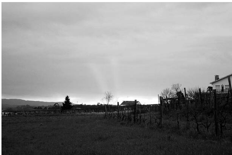
Un solpor coma este, do 24 de febreiro do 2002, no que se ven nubes de cor vermella, indica posibilidade de chuvia para o día seguinte.

en zonas onde abunda máis que na Ulla a gandería ovina. A palabra rubiás sería máis propia da provincia de Ourense que do Val do Ulla.